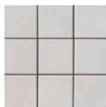
10 x 10 CM