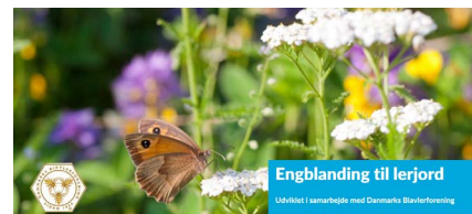
DLF, Engblanding til lerjord, bi-mærket (flerårig), maj-oktober

https://nykilde.dk/shop/17-blomstermarksfroe-blandinger/224-honningbi-fest-fleraarig-froeblanding-500-g/