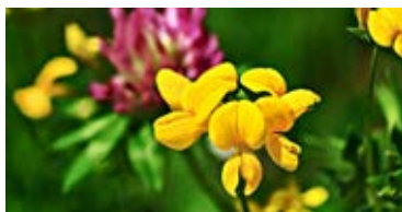
DSV Bi- & Insektblanding (flerårig) juni- november

På nedenstående link kan du se nogle eksempler på forskellige insektblandinger. God fornøjelse:-)